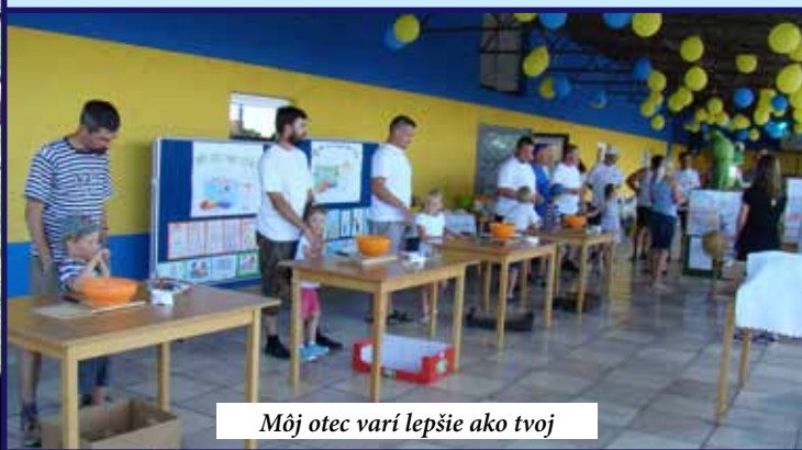
Môj otec varí lepšie ako tvoj