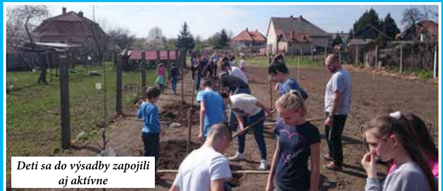
Deti sa do výsadby zapojili aj aktívne

dreviny.“ Nevylučuje ani možnosť výučby vonku v areáli školy, ktorá sa nemusí týkať iba predmetov, ako je biológia či botanika. „Nemusí byť človek iba biológ, aby využíval tento spôsob výučby.“