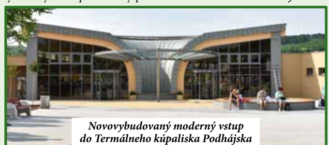
Novovybudovaný moderný vstup do Termálneho kúpaliska Podhájska