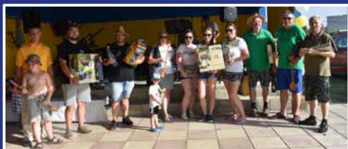
Hudba, nafukovacie atrakcie pre deti i dospelých, súťaž v strelbe a vo varení gulášu, skvelá tombola a zábava – na 9. ročníku Fedýmešského kotlíka vládla tento rok vynikajúca atmosféra!