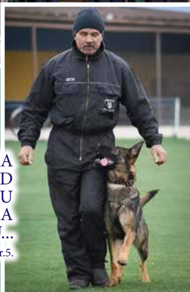
KYNOLÓGOVIA Z ÚĽAN NAD ŽITAVOU SA NEVZDÁVAJÚ... str.5.