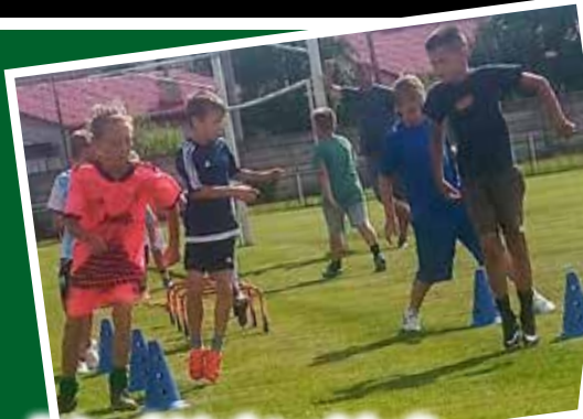
Prípravkári v lete odohrali niekoľko prípravných zápasov /str.4.