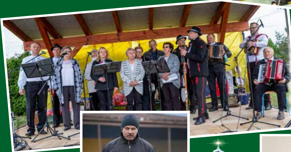
Naši seniori pomáhali tento rok skrášľovať obec str.3.