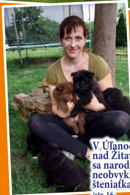
V Úľanoch nad Žitavou sa narodili neobvyklé šteniatka /str. 16