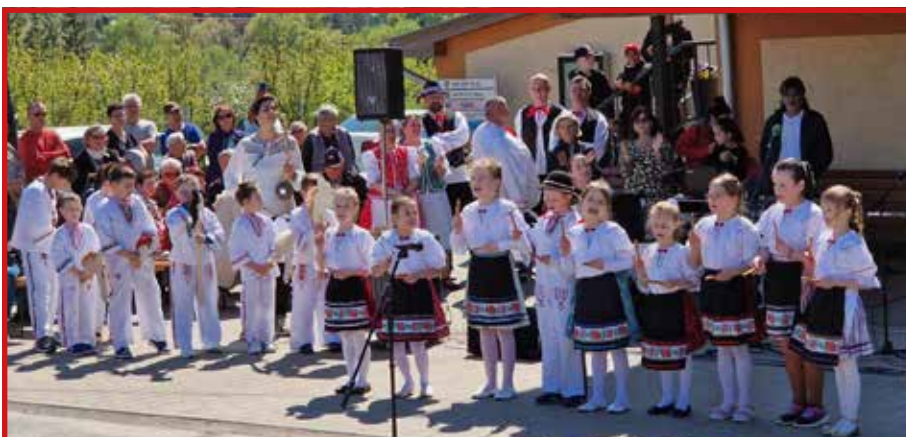
Stavanie mája pred OÚ 2023