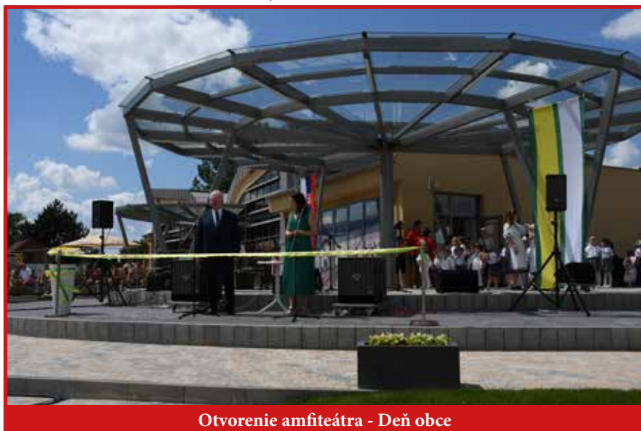
Otvorenie amfiteátra - Deň obce

denne navštívi veľké množstvo ľudí, je tu veľmi potrebná kanalizácia, preto sa budeme snažiť začať s jej výstavbou. Bohužiaľ, vzhľadom na politické okolnosti