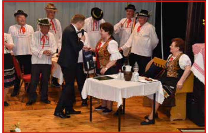
Výročná schôdza klubu dôchodcov