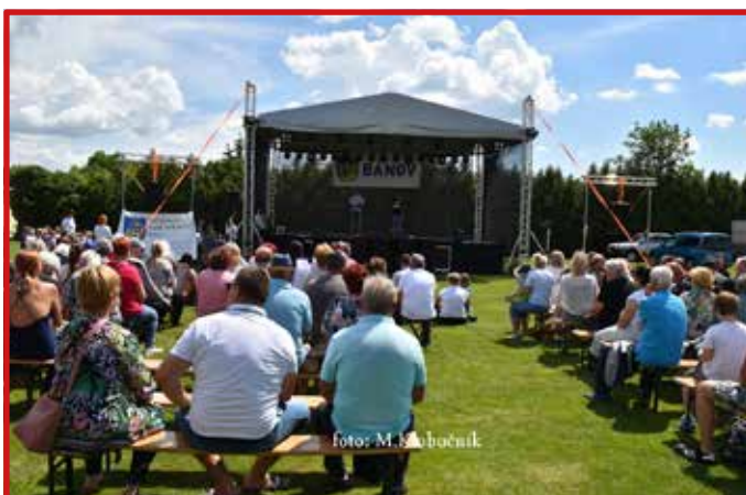
Dni obce Bánov