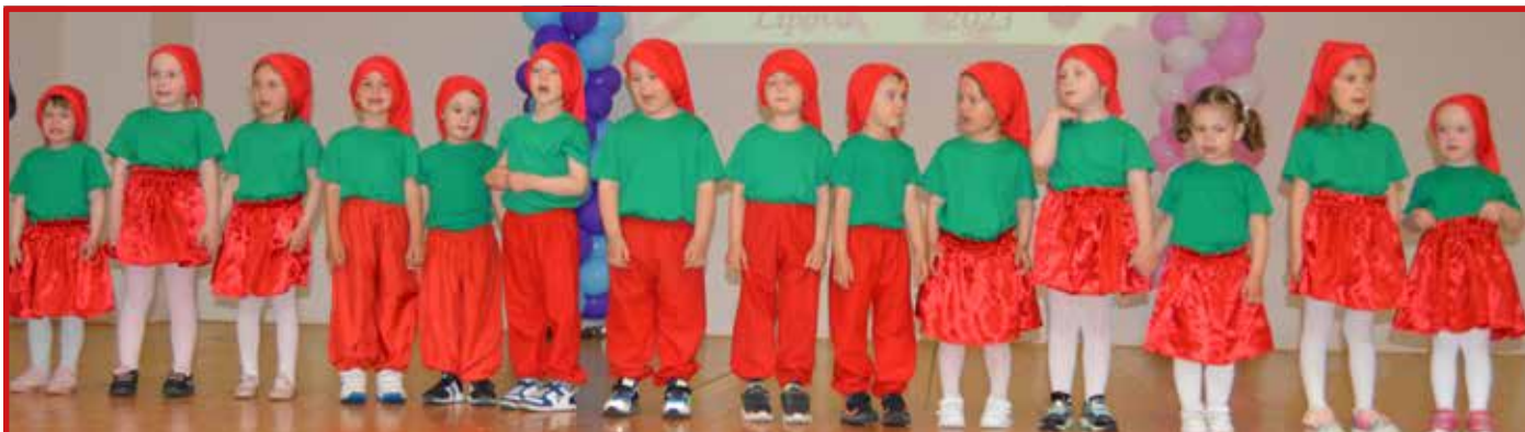
Deň matiek – Druhá májová nedeľa tradične patrila mamičkám, ktorým sa ich deti poďakovali za všetko, čo pre ne robia.