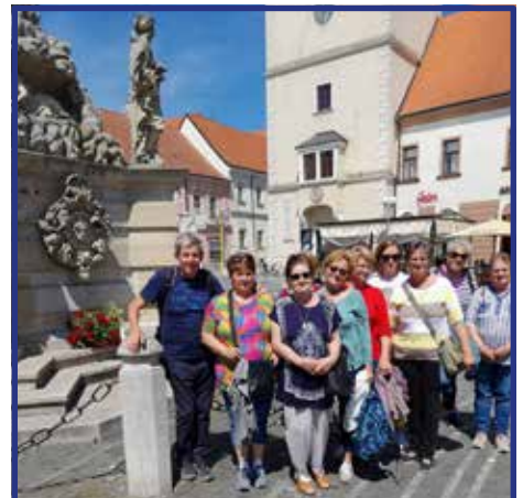
13.6.2023 – Na prehliadke pamiatok a kostolov v Trnave

Naši seniori sú súťaživí. 9. 6. 2023 sa zúčastnili Okresnej olympiády seniorov v Nových Zámkoch. Všetci, ktorí reprezentovali ZO JDS v Lipovej, získali medaily. Blahoželáme a ďakujeme za reprezentáciu Lipovej.