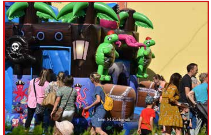
Obecný deň detí