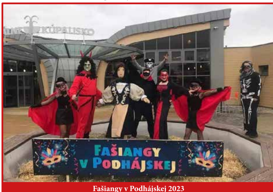
Fašiangy v Podhájskej 2023