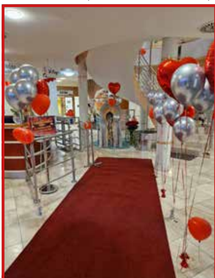
Valentínska noc 2023

Komunálne voľby sú dôležitým momentom pre každú samosprávu, pretože umožňujú občanom rozhodovať o budúcnosti svojich obcí. Ako to už býva, niektorí starostovia úspešne obhájili svoje funkcie a iní dostali novú príležitosť na vedenie svojich obcí. Takúto príležitosť dostal aj starosta obce Podháj-