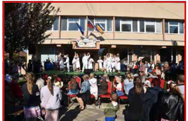
Predvečer 1. mája