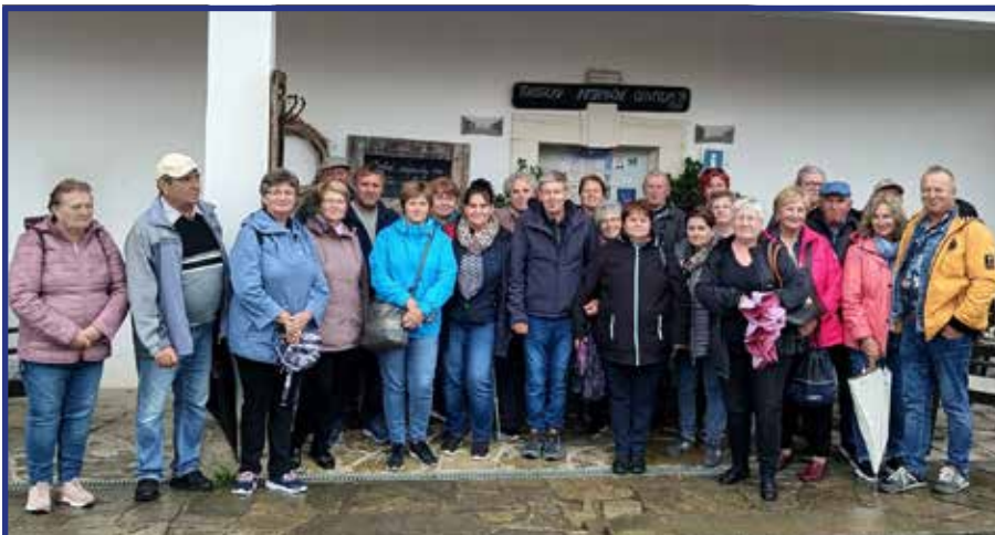
16.5.2023 – V Skalici a na Holíčskom zámku...