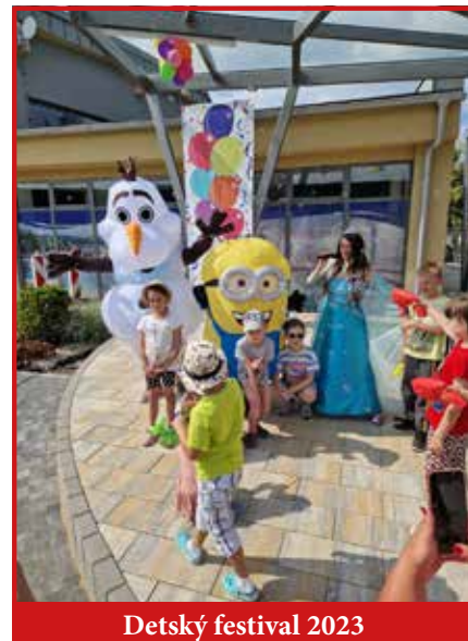
Detský festival 2023

- Obec ako takú budujem, je tu dosť veľa zanedbaných vecí, čo doniesli predchádzajúce generácie, ale to je vec, ktorá sa nedá zmeniť, my musíme hľadiť dopredu. Mojm cieľom nie je pozeráť sa chyby z minulosti, ale skôr sa sústrediť na budovanie perspektívneho rozvoja obce. S ohľadom na fakt, že Podhájsku