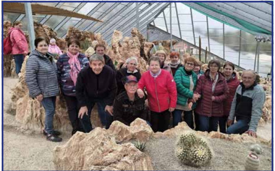
3.5.2023 – Na výlete v Bojniciach