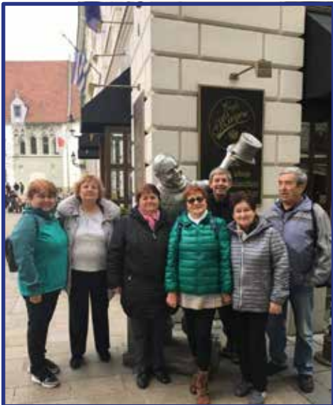
31.3.2023 – Na Bratislavskom hrade...