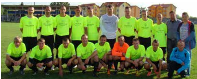
Družstvo Pusté Úľany