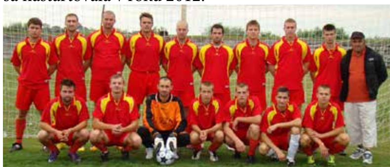
Družstvo Úľany nad Žitavou

V spolupráci s TJ Lokomotíva. Ide o obce: Ipelenské Úľany, Pusté Úľany, Úľany nad Žitavou, Veľké Úľany. História tohto turnaja spadá do roku 1987 až 1991, kedy sa odohrali v štyroch obciach zápasy (jeden rok – jeden turnaj), následne táto tradícia zanikla a znovu sa naštartovala v roku 2012.