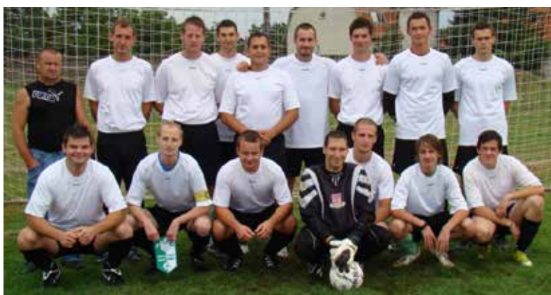
Družstvo Ipelenské Úľany