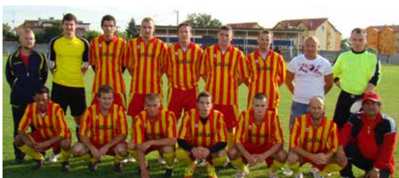
Družstvo Veľké Úľany